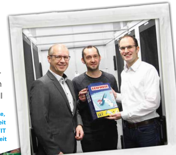
Schnell, sicher, immer verfügbar: Die Server-Lösung von DOKOM21